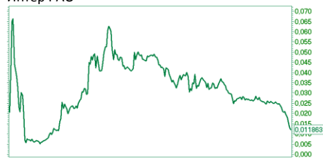
– ИнтерРАО [Price]

2008 2009 May Sep 2010 May Sep 2011 May Aug 2012 May Sep 2013