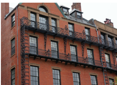
Многоквартирный жилой дом, Бостон.