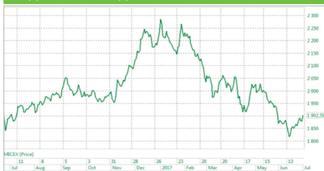
Индекс ММВБ дневной

Рынок демонстрировал восстановление после резкой коррекции в середине июня. Индекс ММВБ вернулся на уровень 1900 п., а индекс РТС вырос до психологически важной отметки 1000 п. При этом курс USD/RUB достигал максимального значения с начала года, а евро вырос к рублю до максимума с декабря 2016-го.