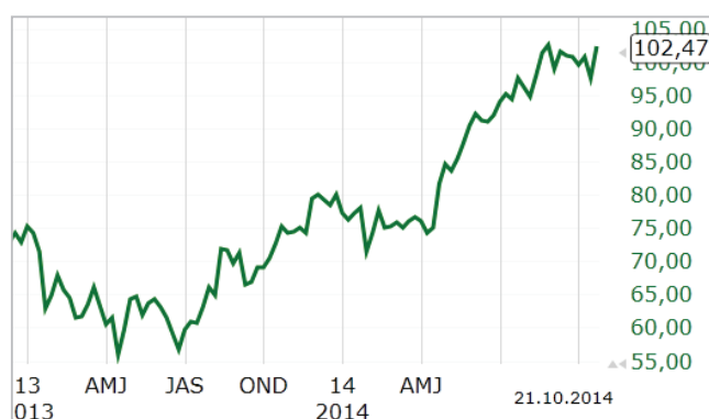
График акций Apple.

Dow-Jones 30. Некоторые аналитики считают, что сплит акций был сделан для того, чтобы попасть в главный американский фондовый индекс, куда из-за системы подсчета, дорогим акциям путь закрыт. Если акции Apple попадут в расчет данного индекса, это будет признание значимости компании для американской экономики, что положительно скажется на котировках.