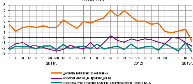
Индексы предпринимательской уверенности с исключением сезонного фактора (процентов)

Индекс предпринимательской уверенности традиционно вырос до 4%. Однако с учетом оценки сезонного фактора наблюдается не рост, а снижение индекса. На замедление экономики обратили внимание в Правительстве, до 15 мая поручено разработать меры по стимулированию экономического роста.